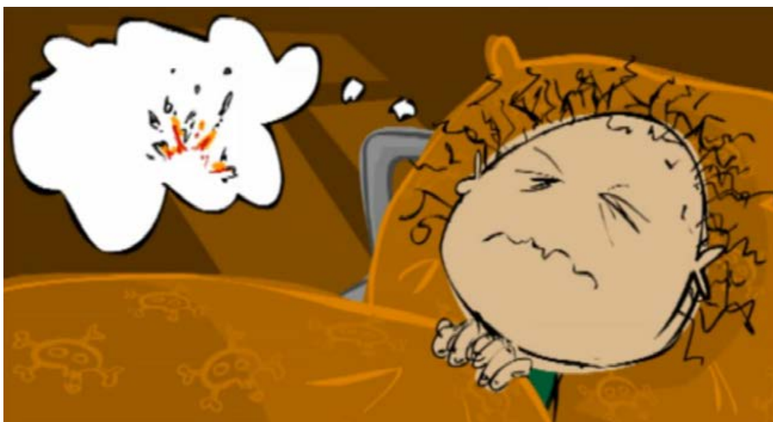
Stillbillede fra filmen 'Traumer i familien'

Diagnosen PTSD stilles til både børn og voksne. PTSD hos børn ligner den, der ses hos voksne, og omfatter ligeledes reaktioner som stress, genoplevelser og undgåelsesadfærd. Symptomerne viser sig dog ofte på andre måder hos børn, afhængigt af barnets alder og udviklingstrin. Børn er særligt udsatte, og traumatiske oplevelser kan få betydning for deres emotionelle og kognitive udvikling. I det daglige arbejde med flygtningebørn er det derfor vigtigt at kunne genkende symptomer på traumer og PTSD, så der kan gribes ind med den rigtige hjælp i tide.