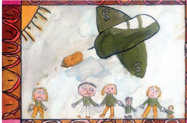
Elev i 4. klasse, projekt 'Børn af Krig og Fred' 2011