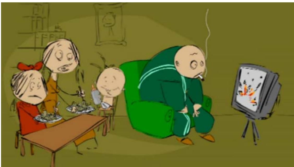
Stillbillede fra filmen 'Traumer i familien'

Forældrenes symptomer og reaktioner som følge af traumer kan således medføre manglende følelsesmæssigt nærvær og opmærksomhed over for børnene. Er forældrene stressede og anspændte, vil børnene ofte være nervøse og på vagt. Også forældres detaljerede beretninger om grusomme oplevelser, såsom tortur, vold og overgreb, kan påføre barnet sekundær traumatisering. Derudover kan nyhedsudsendelser fra hjemlandet præge stemningen i hjemmet og dermed påvirke både forældre og børns psykiske tilstand.