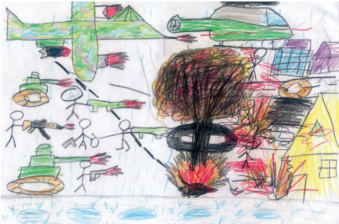
Elev i 4. klasse, projekt 'Børn af Krig og Fred' 2011

Nogle børn har symptomer på både internalisering og eksternalisering. Levine og Kline påpeger, at piger oftere har tendens til at internalisere deres symptomer, mens drenge typisk eksternaliserer dem. Det er dog vigtigt at være opmærksom på, at begge reaktionsmønstre kan forekomme hos begge køn.